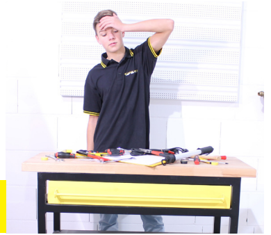
Unordnung und Chaos in der Werkstatt? Wir haben die Lösung für Sie!

Auf den führenden Fachmessen in Deutschland, der SHK Essen und der IFH Nürnberg, wurde das Tool Board erstmalig erfolgreich präsentiert.